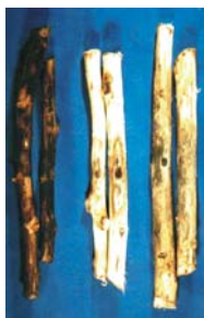
الف ب ج

شکل ۳. تشکیل پودر آرتروکنیدیومی متراکم (الف)، ایجاد شانکر (ب) و تشکیل پودر آرتروکنیدیومی با تراکم کمتر (ج).