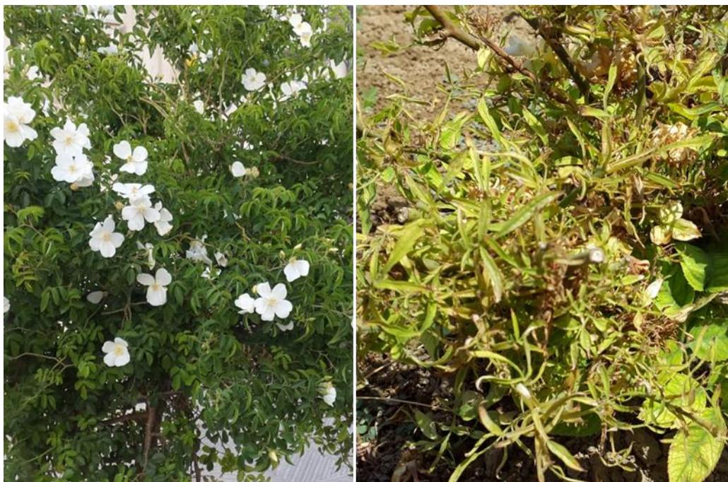
شکل ۱- زردی شدید، برگ‌های بدشکل و لوله شده، کاهش گل‌دهی و تولید گل‌های غیرعادی در گل نسترن بیمار (سمت راست) در مقایسه با گیاه سالم دارای برگ‌ها و گل‌های عادی (سمت چپ)

Figure 1: Severe yellowing, deformed, narrow and curled leaves, poor flowering with incomplete flowers in a diseased dog rose (right) compared to healthy plant (left) with normal leaves and flowers.